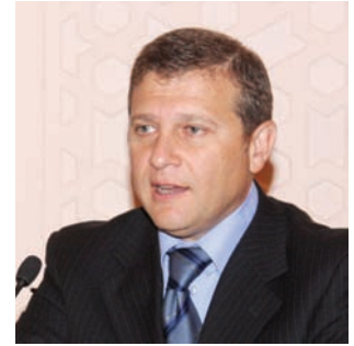
الوزير خالد الايراني