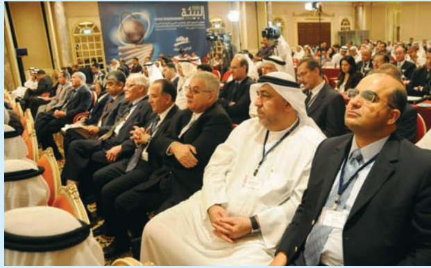
الحضور في مؤتمر البيئة 2008 في المنامة - البحرين

بناية أشمون، طريق الشام، وسط بيروت ص. ب. 5474 - 113 بيروت 2040 - 1103، لبنان هاتف: 321800 - 1 (+961) البريد الإلكتروني: info@afedonline.org