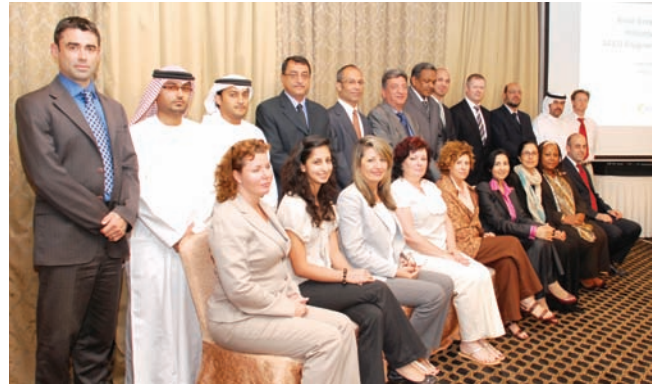
مشاركون في ورشة أبوظبي

توالت ورش العمل حول "المسؤولية البيئية للشركات: التحديات والفرص" التي عقدها المنتدى العربي للبيئة والتنمية (أفد) وبرنامج الأمم المتحدة للبيئة